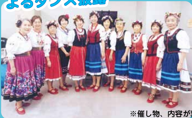
※催し物、内容が変更になる場合があります