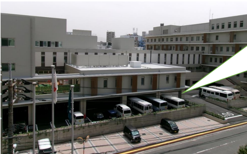
広島市児童相談所及びこども療育センター等建物全景